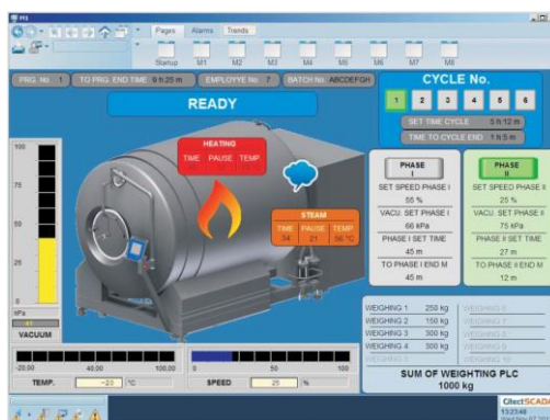
Интерактивное окно параметров.

Наблюдаемые данные могут высвечиваться в виде интерактивного окна или диаграммы работы во времени. Все наблюдаемые параметры могут быть записаны в виде файлов в памяти компьютера. В случае аварии устройства данные могут быть воспроизведены при помощи программы мониторинга. Возможно также составление документации технологического процесса в виде распечатки с диаграммой протекания данных во времени.