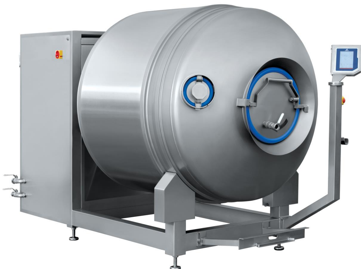
Фото для примера MA-1500 PSCH